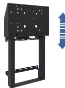
Soporte de pared