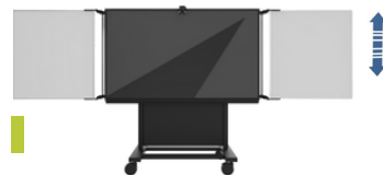
BalanceBox® Winx® 4b