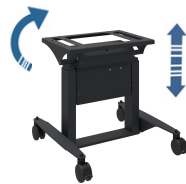
Soporte de mesa basculante